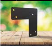
Équerre en "L"