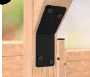
8 Équerre d'assemblage 135°