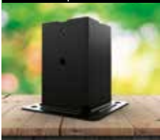
Pied de poteau carré