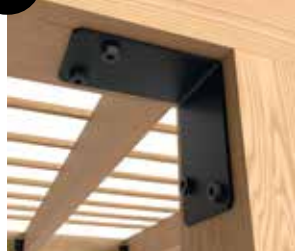
7 Équerre d'assemblage 90°