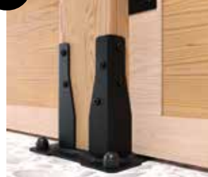
9 Pied de poteau carré