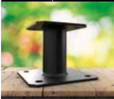
Pied de poteau fixe