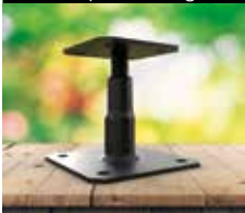
Pied de poteau réglable