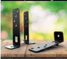
Pied de poteau réglable