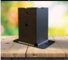
Pied de poteau carré