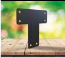
Équerre plate en "T"