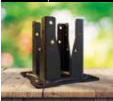
Pied de poteau carré